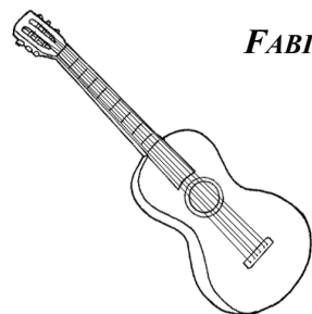
FABIANO MERLANTE chitarra