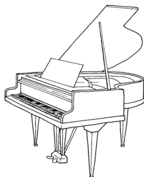
LORENZO GOVONI pianoforte